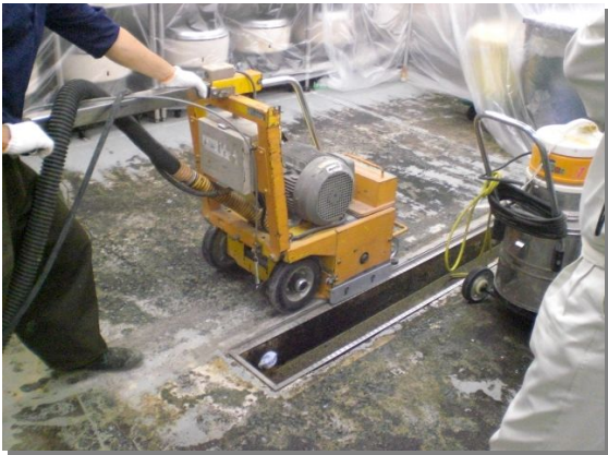
専用吸引削り機械により劣化部の撤去。ホコリも最小限！